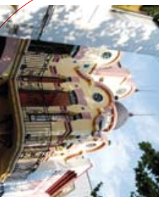
← Casa Renard