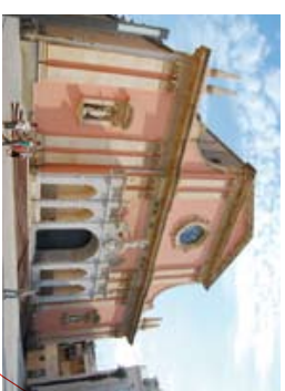
← Església de la Mare de Déu de les Neus