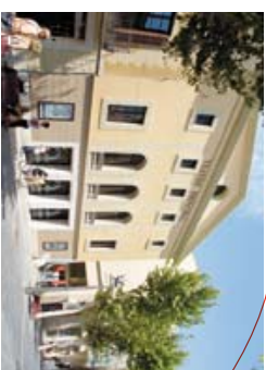
← Teatre Principal