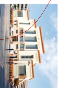
← Mercat Municipal del Centre