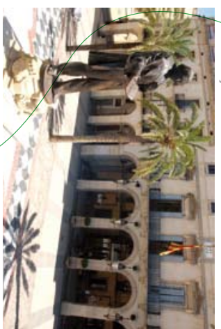
1 ↓ Plauça de la Vila

Més endavant, en el mateix carrer del Bonaire hi ha la casa anomenada del Bosser, receptor reial d'impostos. A la façana es pot veure una dovella amb una bossa gravada.