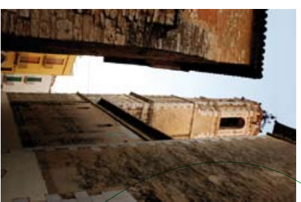
6 ↓ Església de Santa Maria de la Geltrú

Continuarem fins arribar a la cruïlla del carrer del Ravallet i dels Arençaders (4) , que eren la ronda de l'antiga muralla, per resseguir-la i arribar al castell de la Geltrú (5) , reconstruït sobre la base de l'antic castell medieval i actualment habilitat com a Arxiu Històric Comarcal. Al davant mateix del castell hi ha l'església de Santa Maria de la Geltrú (6) , que allotja un bell retaulle de fusta policromada dedicat a l'Assumpció de la Mare de Déu, datat al segle XVIII, amb elements decoratius d'època barroca.