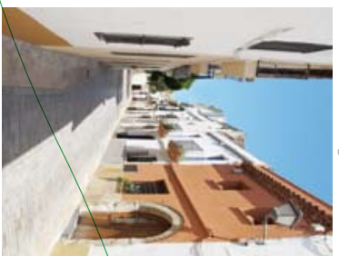
4 ↓ Carrer dels Arençaders