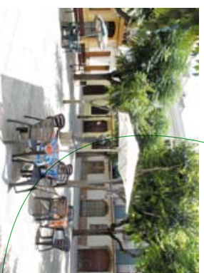
3 ↓ Plauça dels Lledoners

Continuarem fins arribar a la cruïlla del carrer del Ravallet i dels Arençaders (4) , que eren la ronda de l'antiga muralla, per resseguir-la i arribar al castell de la Geltrú (5) , reconstruït sobre la base de l'antic castell medieval i actualment habilitat com a Arxiu Històric Comarcal. Al davant mateix del castell hi ha l'església de Santa Maria de la Geltrú (6) , que allotja un bell retaulle de fusta policromada dedicat a l'Assumpció de la Mare de Déu, datat al segle XVIII, amb elements decoratius d'època barroca.