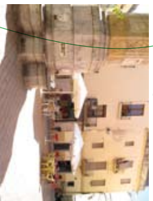
2 ↓ Plauça de Miró de Montgrós